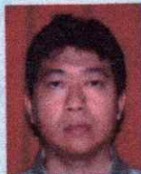
KOTA SEMARANG 21-05-2018